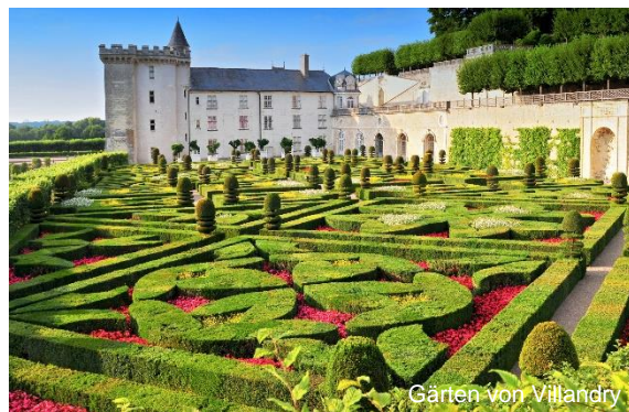
Gärten von Villandry

Die gotische Kathedrale Saint-Gatien besitzt einen bedeutenden Zyklus mittelalterlicher Glasfenster. Aus der Renaissancezeit stammt das Grabmal für die als Kleinkinder verstorbenen Söhne der Anne de Bretagne. Das Grab des heiligen Martin befindet sich heute in einem nebyzantinischen Neubau. Von dort ist der Weg nicht weit zur idyllischen Place Plumereau mit ihren alten Fachwerkbauten. Am Nachmittag geht es zum Schlösschen L'Islette, wo an die unglückliche Bildhauerin Camille Claudel und ihren Geliebten Auguste Rodin erinnert wird. Anschließend laden die Gärten von Villandry mit ihren ornamental gestalteten Beeten, in denen auch Gemüse zum Schmuck wird, zur Entspannung ein.